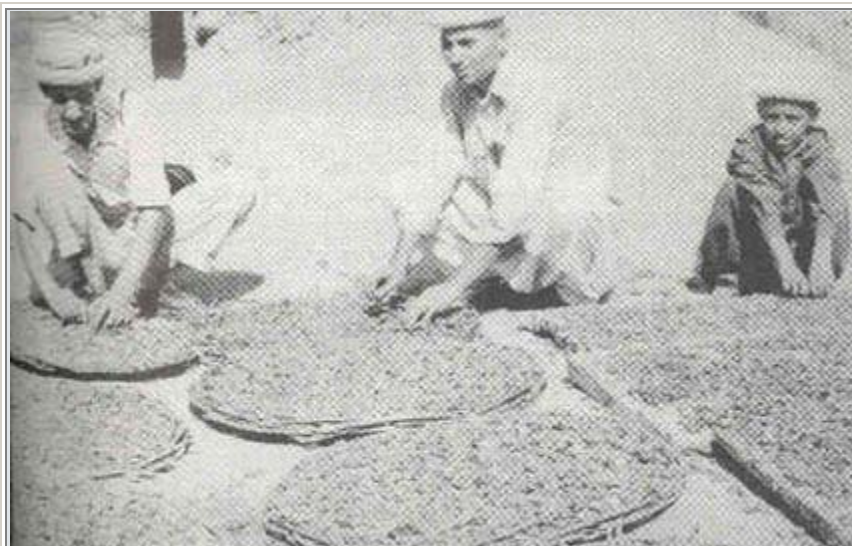
pripadnici plemena Hunza skupljaju koštice kajsije

Tako u jelovniku Eskima i Indijanaca, koji takodje ne pate od ovih bolesti, prevladjuje meso koje uključuje i divljač. To je najčešće meso jelena, dopunjeno raznim divljim bobičavim sezonskim voćem. Što je najzanimljivije, kod ovih ljudi uošte ne postoji gojaznost, iako svakodnevno u organizam unose velike količine životinjske masti.