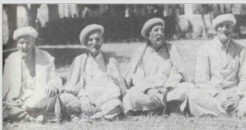
četiri devedesetogodišnjaka iz plemena Hunza

Krebs je zapravo našao da postoje još dve grupe ljudi koje uopšte ne oboljevaju od raka. Jedni su upravo mesojedi, drugi biljojedi.