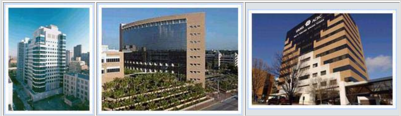
velelepne zgrade nekih centara za istraživanje raka

Čak 200 MILIJARDI dolara godišnje u svetu troši se na istraživanja o nastanku raka, na lečenje uz pomoć citostatika i ostalih skupih medikamenata, zračenja, hirurške tretmane, itd. Američko "Društvo za borbu protiv raka" je najbogatija neprofitna organizacija u svetu. Mnoge žrtve ove "opake bolesti" zaveštavale su, i dalje to čine, čitavu imovinu ovoj organizaciji, verujući u njene iskrene napore da bolesti stane na put i konačno pronadje famozni lek. O naporima miliona obolelih širom sveta koji grozničavo pokušavaju da stignu u prestižne i skupe američke klinike, specijalizovane za rak i dobiju najbolji (i najskuplji) tretman, ne treba ni govoriti. I naši su mediji puni apela za novčanom pomoći unesrećene dece i mladih ljudi.